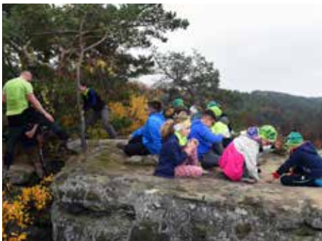
Nejvíce si děti pochvalují zejména pobyt v písčivcových skalách