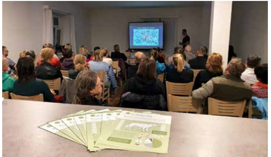
Na přednášku dorazilo více jak padesát posluchačů, kteří se aktivně zapojovali do diskuze

https://www.mikulasovice.cz/sprava-np-cs-vlci-na-sluknovsku/