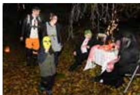
Fotoprávy - str. 8