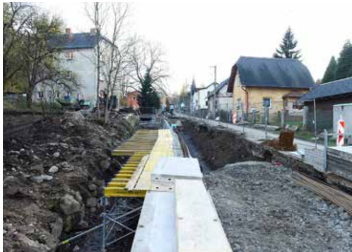
Uzavření komunikace od železničního přejezdu v dolních Mikulášovicích směrem do Vilémova stále pokračuje z důvodu rozsáhlé rekonstrukce přílehlého koryta potoka. Od prosince bude průjezd na semaforu.