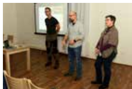
Vlci na Šluknovsku - str. 2