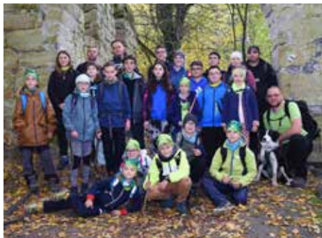
Každoroční ukončení závodní sezony si mikulášovický turistický oddíl mládeže užívá v přírodě