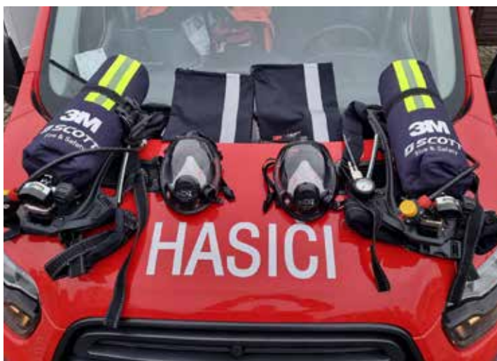
Naši dobrovolní hasiči obdrželi nadační příspěvek od Nadace ČEZ ve výši 79.200 Kč na pořízení zásahové techniky, která je potřebná pro jejich práci. Z příspěvku byly pořízeny dva kompletní dýchací přístroje. Město Mikulášovice a Sbor dobrovolných hasičů Mikulášovice tímto děkuje Nadaci ČEZ za podporu a spolupráci.