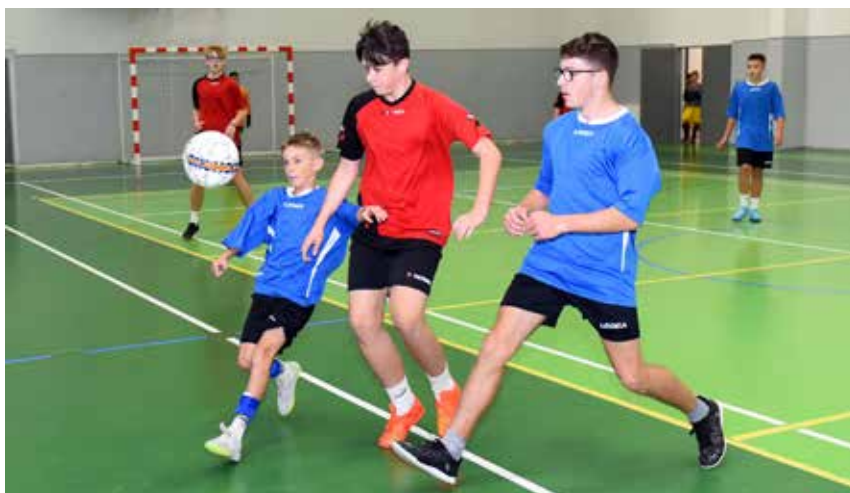
Nejtěžším soupeřem bylo pro mikulášovické fotbalisty družstvo z Dolní Poustevny, které nakonec přehráli až v samotném závěru

Školní sportovní liga vstoupila do nového ročníku, zahajovacím zápolením mezi školami Šluknovského výběžku byl fotbalový turnaj, který pořádala ZŠ Dolní Poustevna. Turnaj se odehrál systémem každý s každým s průběžným střídáním. Mikulášovice opět nasadily do turnaje zejména mladší žáky, což se nakonec vyplatilo. Chlapci naší školy odehráli všechny zápasy bez jediné prohry a zaslouženě obsadili první příčku, před druhým Šluknovem a třetím Rumburkem. Dalším turnajem na pořadu v rámci celoročního sportovního zápolení mezi školami bude přehazovaná děvčat v mikulášovické sportovní hale.