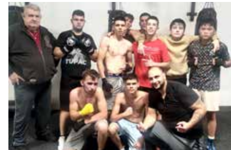
Tým mikulášovických boxerů kategorie mladšího dorostu s trenéry