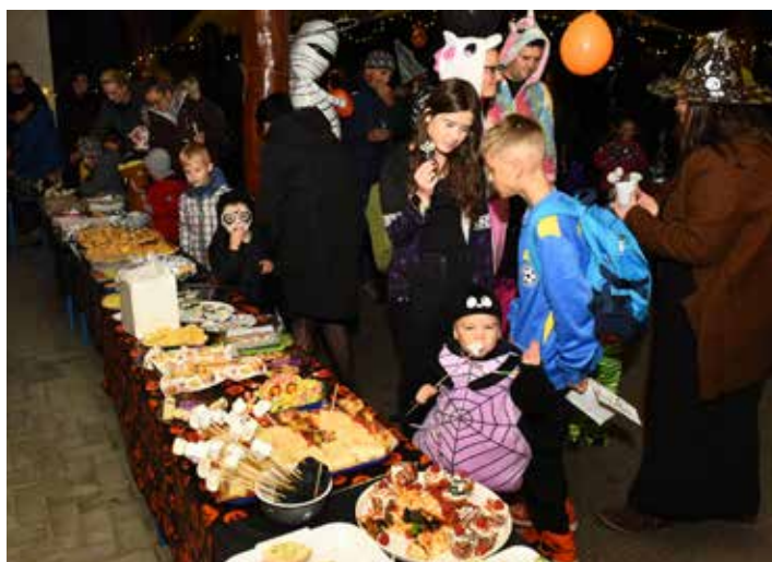
Halloweenký večer si užily děti a jejich rodiče v místní mateřské škole. Interaktivní program plný zajímavých překvapení se odehrával na školní zahradě a následně pak po chodbách budovy MŠ. Večer provázela skvělá atmosféra, děti i organizátorky přišly ve stylových převlecích a nechybělo ani zajímavé občerstvení.