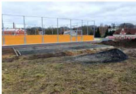
Za tělocvičnou a horní školou stále probíhají terénní a stavební práce v souvislosti s výstavbou nového multifunkčního hřiště