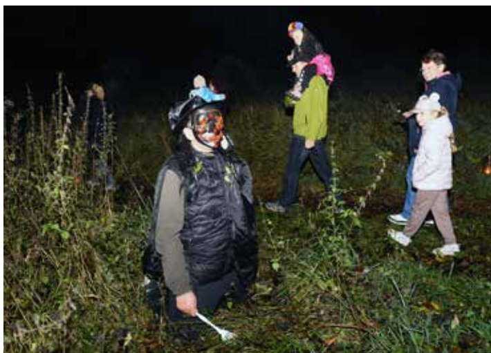
Halloweenkou stezku odvahy uspořádala pro veřejnost ZŠ a MŠ Mikulášovice za podpory MAS Český Sever, akce byla spolufinancována EU. Všichni účastníci si tak mohli vychutnat parádní zážitek. Večer plný duchů a strašidel podpořilo i počasí, mlha, která se snesla na louku za školou byla opravdu strašidelná.