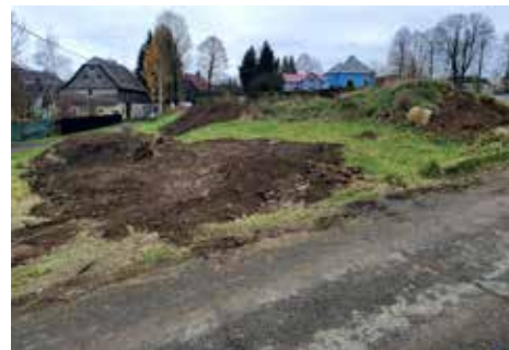
Vyřezávání nevzhledných náletových dřevin a následné povrchové úpravy probíhají také v prostoru bývalého Rukova u sídlíště