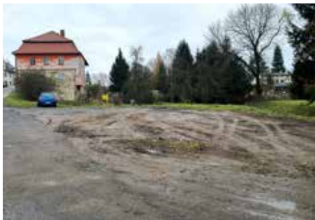
V prostoru vedle hvězdárny a čp. 2 byla odvezena uskladněná zemina