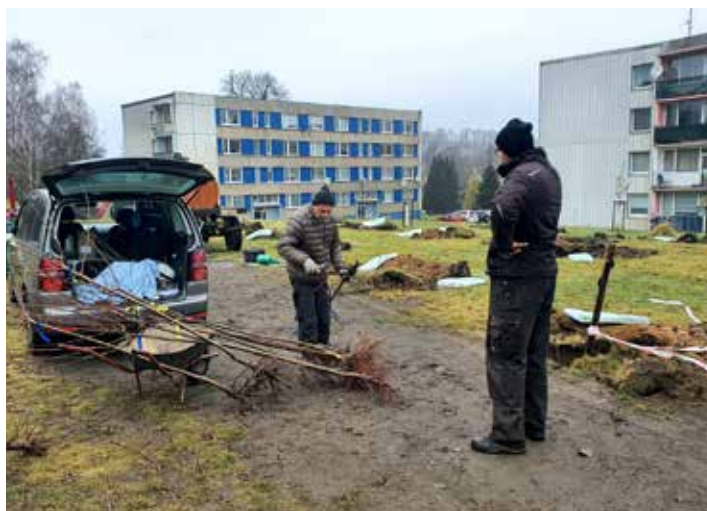
Děkujeme všem ochotným dobrovolníkům, kteří se zúčastnili sázení ovocných stromů za mikulášovickým sídlištěm. Při samotném vysazování panovalo velmi nevlídné počasí, o to víc si musíme vážit jejich pomoci.