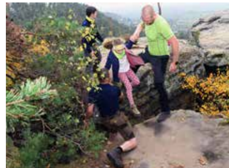
Letošní výpravě do Českého ráje přálo i počasí a tak jsme se bezpečně dostali i na skalní vyhlídky