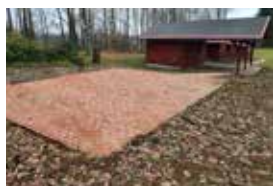
Děni v našem městě - str. 3